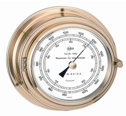
Fig. 2- Barômetro.

No entanto os instrumentos utilizados para medir a pressão atmosférica são conhecidos como barômetros.